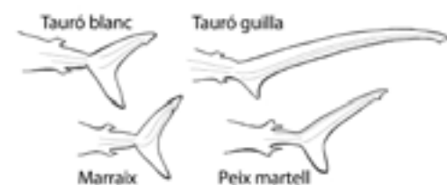
Aletes caudals d'alguns taurons

Els taurons més ràpids, com els pelàgics (que viuen a mar obert, allunyats del fons), tenen un tacte menys aspre perquè els seus denticles són més petits i lleugers que els dels taurons bentònics (que viuen al fons), que presenten la pell més rugosa.