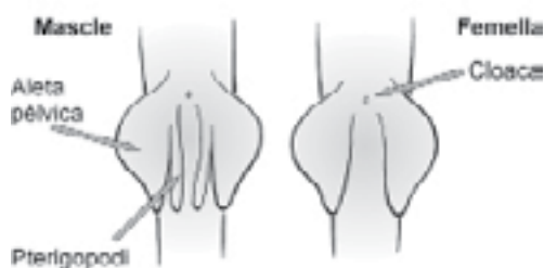
Visió ventral del tauró mascle i del tauró femella

Ovípara. Els ous són alliberats a l'exterior. Són ous grans i ben protegits. Sovint presenten uns cirrells que els fixen a les algues o les gorgònies. És el cas del peix gat ( Scyliorhinus canicula ).