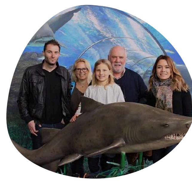
FOTOGRAFÍA DE RECUERDO