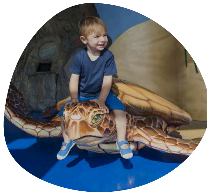
TALLERES PARA TODAS LAS EDADES