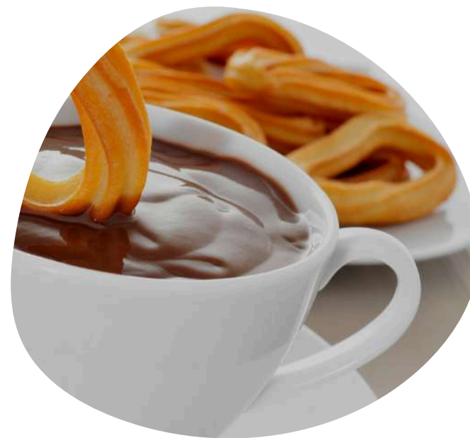
DESAYUNO O MERIENDA EN FAMILIA